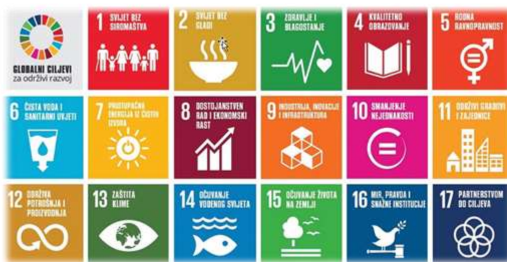
Slika 2. Slika Ciljevi održivog razvoja

Detaljniji opis razvojnih mjera Općine Tučepi vidljiv je u narednim tablicama.